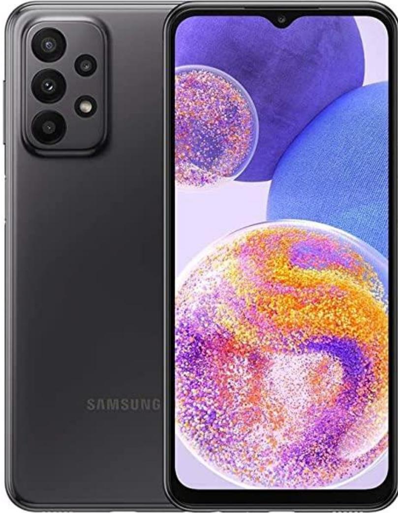
شكل رقم (4) يوضح

توظيف التصميم المرئي للتسويق عن الإلكترونيات من موقع أمازون