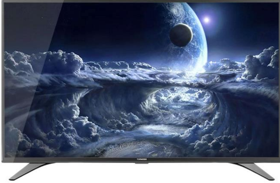
شكل رقم (2) من موقع جوميا يوضح

تصميم مرئي يستخدم الألوان الباردة ويوظف الظل والضوء في التسويق إلى شاشة عرض