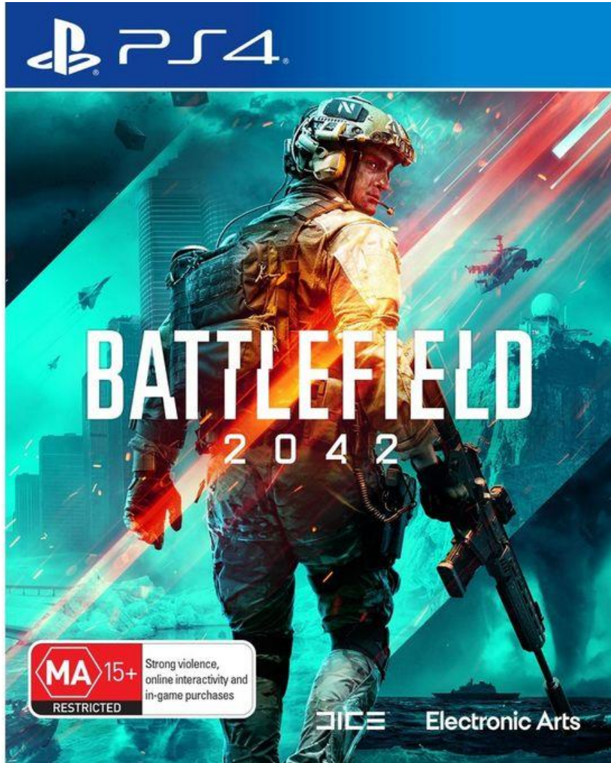
شكل رقم (5) يوضح تصميم مرئي للإعلان عن بلاي ستيشن من موقع جوميا